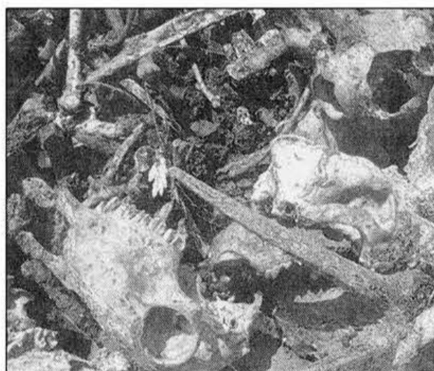
Comme en mars, des spéléos franc-comtois ont apporté un fort soutien aux locaux, en particulier sur le plan logistique, à cette opération d'ampleur inédite en France. Ossements et munitions constituent l'essentiel d'un impressionnant inventaire. Des bennes du Sictoba ont été mises à contribution pour entreposer ces résidus.